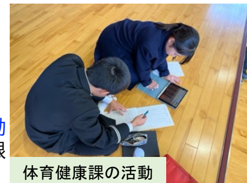
体育健康課の活動