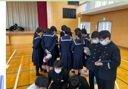
交流推進課のイベント

昼休みの体育館の光景です。この日は、2つの課活動が活動していました。「交流推進課」は、得意教科の「先生役」生徒に、他の生徒が質問するという企画を実施していました。なかなか面白い企画でした。ステージ上では「体育健康課」が駅伝大会に向けてのチーム編成確認を行っていました。ありがとうございます。 課活動、活発に活動していて頼もしい限り です。