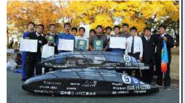
写真: エコデンレース全国大会優勝